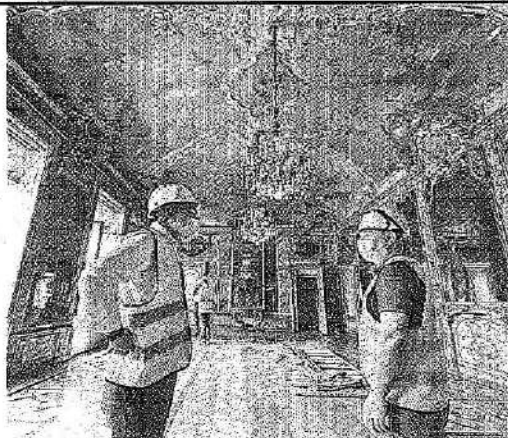
Al lavoro da gennaio Il cantiere per trasformare Palazzo Turinetti di Pertengo, in piazza San Carlo, sede di Intesa Sanpaolo nella quarta "Galleria d'Italia" si concluderà nell'aprile del prossimo anno